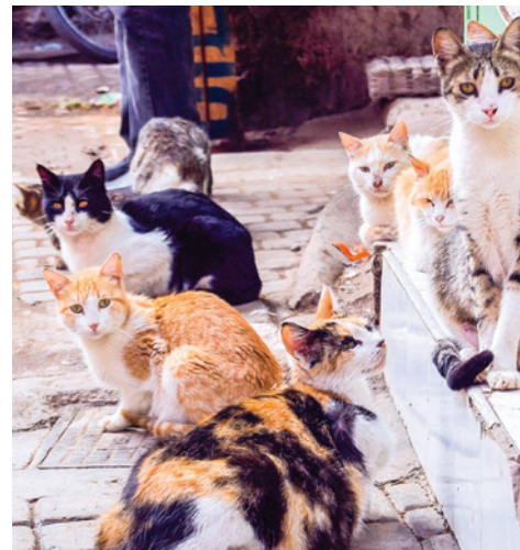
Notoedres mijten kunnen zich snel verspreiden binnen een groep katten

Het is belangrijk om alle contactdieren te behandelen en besmette ligplaatsen te vervangen 2 .