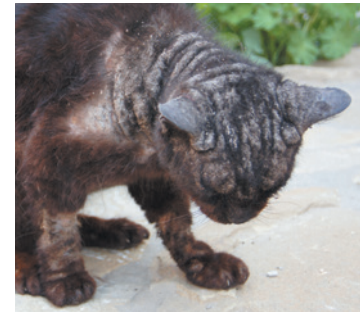
Notoedres cati infectie F