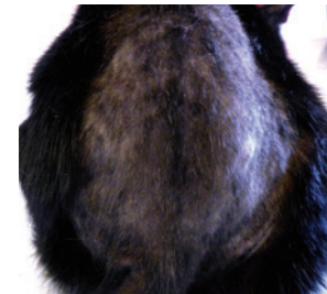
Vlooiënallergie dermatitis 2